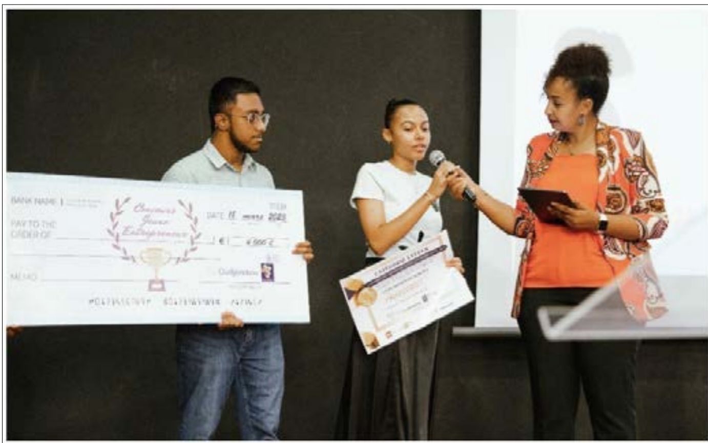
Concours Jeune entrepreneur 2023, Cat. Lycéen, lauréat 1 – Lycée Y. Bamana (projet Charconut) (@Oudjerebou)