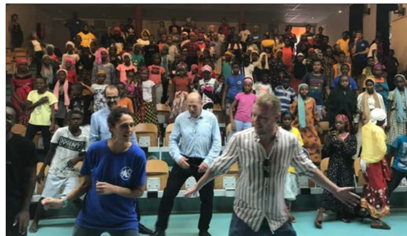
L'après-midi s'est terminé avec un flash mob