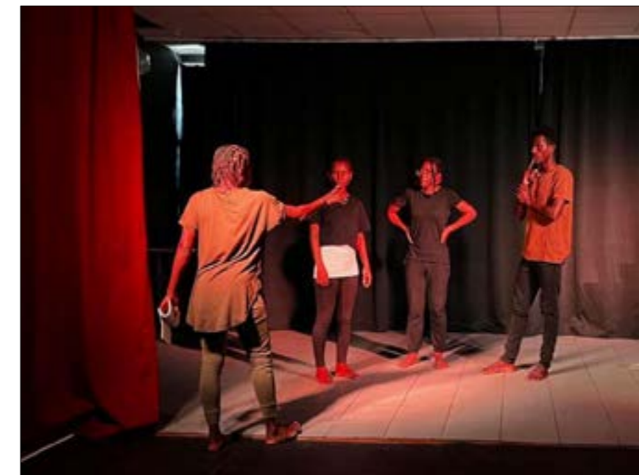
Cours de théâtre dans le cadre du DU Pratiques du spectacle vivant