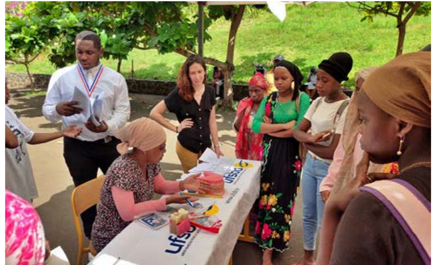
La santé bucco-dentaire était également au rendez-vous lors de cette matinée de sensibilisation.