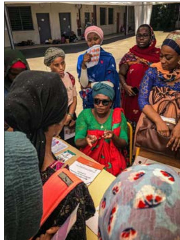
Grande écoute et sensibilisation auprès du stand de la Maison départementale des personnes handicapées et Mayotte (Mdph976)