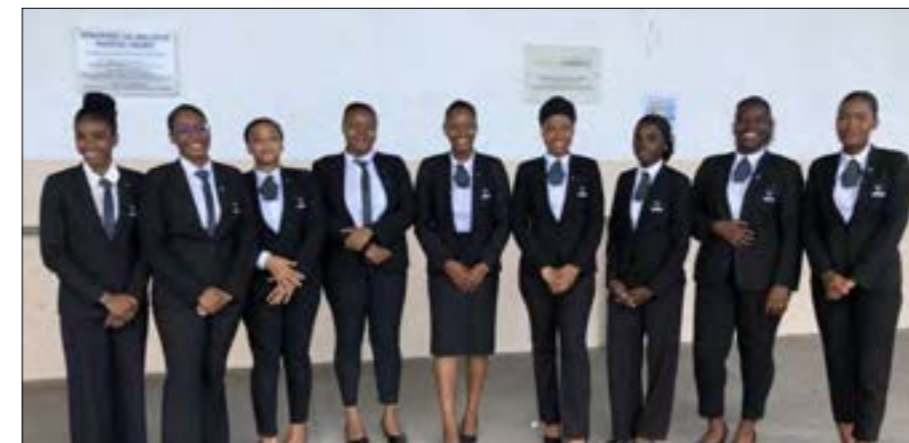
Réception, Housekeeping, Cuisine ou encore Salle côté restaurant. Toutes les spécialités sont ainsi représentées

Souhaitons à ces futures professionnelles du raffinement et de la Bienséance de s'épanouir pleinement dans cette aventure et de revenir nourries d'envies et de nouvelles compétences au service du développement touristique de notre île aux doux parfums et au Lagon.