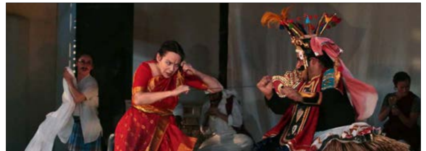
Représentation de la pièce Une chambre en Inde, par la célèbre troupe du Théâtre du Soleil®

Des échanges bienveillants et spontanés ayant amené l'idée de créer une école nomade sur Mayotte avec le plein appui de la DAC et du rectorat, qui ont tout de suite adhéré et cru au bien fondé de ce projet. C'est donc en juillet 2019 qu'une partie de la troupe des professionnels du Théâtre du Soleil est venue donner, durant 3 semaines, souffle de vie, encadrement, conseils et cours à une centaine de stagiaires étudiants, lycéens, jeunes des quartiers populaires et même adultes demandeurs, ayant déjà une première approche des planches et du spectacle. Et quel succès ! Un succès tel qu'à la rentrée suivante, il fut créé le tout premier Diplôme universitaire (DU) Pratiques du spectacle vivant . Un enseignement modulaire