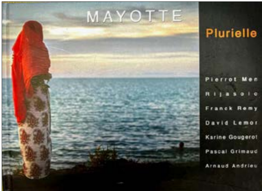
Co-création d'un livre face à face de photographies de professionnels en miroir avec celles des étudiants d'une des riches master class proposée par le Cufir