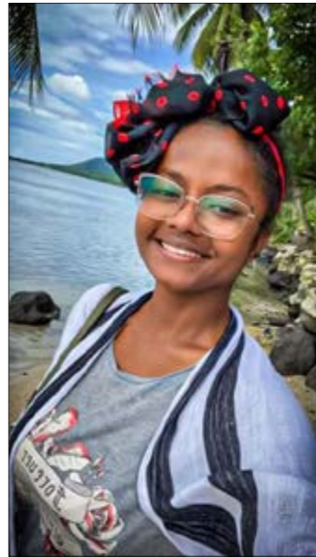
An-Ichat Kafé « On a eu la chance de transiter par Los Angeles; c'était complétement fou d'entendre parler anglais et de survoler cette ville tant rêvée »