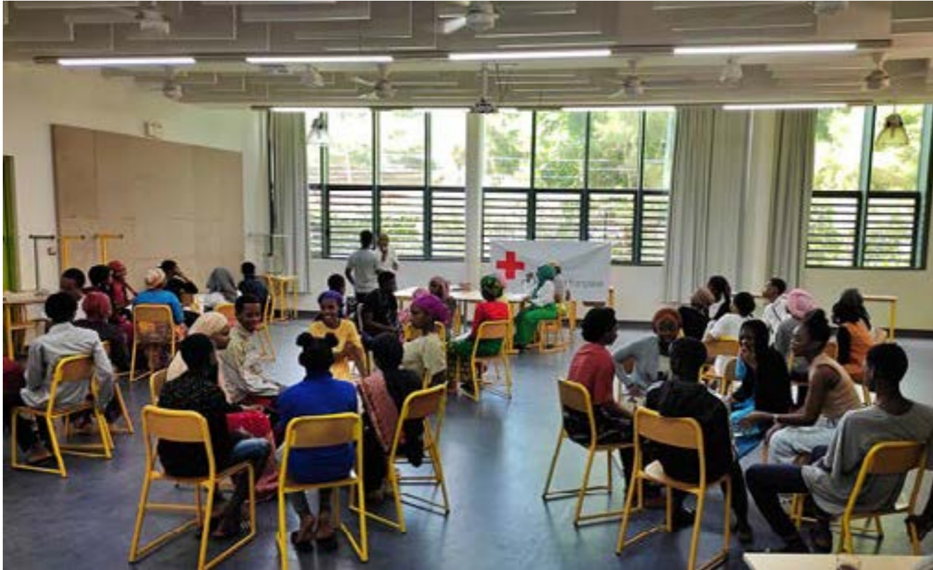
Un atelier axé autour de la santé sexuelle était organisé par la Croix-Rouge.

Dans le cadre de la journée mondiale de la santé, célébrée chaque année le 7 avril, le lycée de Dembéni, à Tsararano, était animé par une journée de sensibilisation et de prévention. Organisée par les élèves en première année du Brevet de technicien supérieur Services et prestations des secteurs sanitaire et social (SP3S), cette journée a permis sensibiliser aux enjeux de santé plus de 650 élèves de l'établissement.