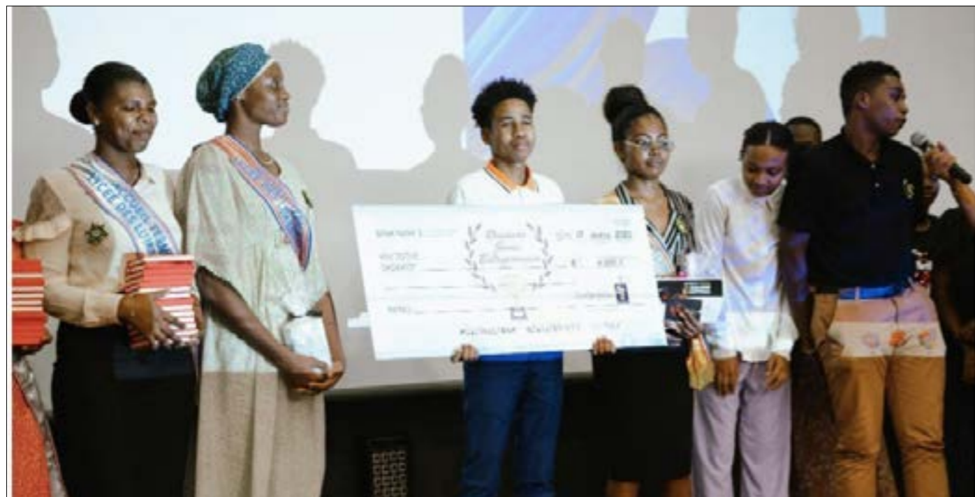
Concours Jeune entrepreneur 2023, Cat. Étudiant, lauréat 1 – Lycée des lumières (projet Cercl (@Oudjerebou)

À cette préceuse vision se greffe également la volonté d'une intelligente et complémentaire mutualisation aussi