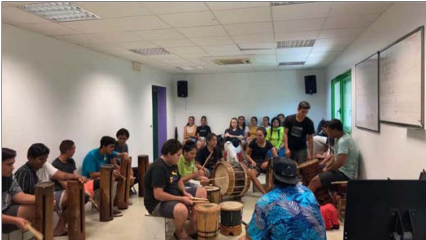
Cours de percussions traditionnelles au Conservatoire des arts, en Polynésie française

sur 2 ans, représentant 524 heures de cours étalées sur le calendrier des congés, les périodes où il n'y a pas cours ou encore durant les créneaux Cufi dédiés à la Culture. Sous réserve d'un minimum de pratique, même informelle, et de connaissances initiales en la matière, d'un projet universitaire et /ou professionnel cohérent, les étudiants déjà inscrits en cycle universitaire, et même certains jeunes sans baccalauréat, ont pu postuler à cette toute première promotion. Une promotion de 11 élus qui s'achèvera en décembre prochain, parrainée par Ariane Mnouchkine / le Théâtre du Soleil à Paris mais également l' École supérieure de théâtre de l'Union à Limoges . La force de ce DU, au final tremplin, réside dans la création rapide et solide d'un réseau de contacts et d'échanges, garantissant ainsi concret suivi pour la poursuite du cursus de l'étudiant. Durant cette formation, totalement gratuite et prise en charge, les stages s'effectuent au Royaume des fleurs à Dzaoudzi , au Pôle culturel de Chirongui mais également à Limoges ou encore à Paris ; de quoi susciter davantage d'envie.