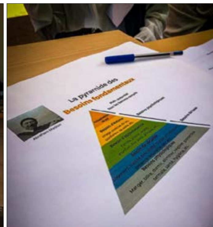
Pyramide des besoins fondamentaux liés aussi à la notion de Bonheur présentée au stand dédié à la Psychologie