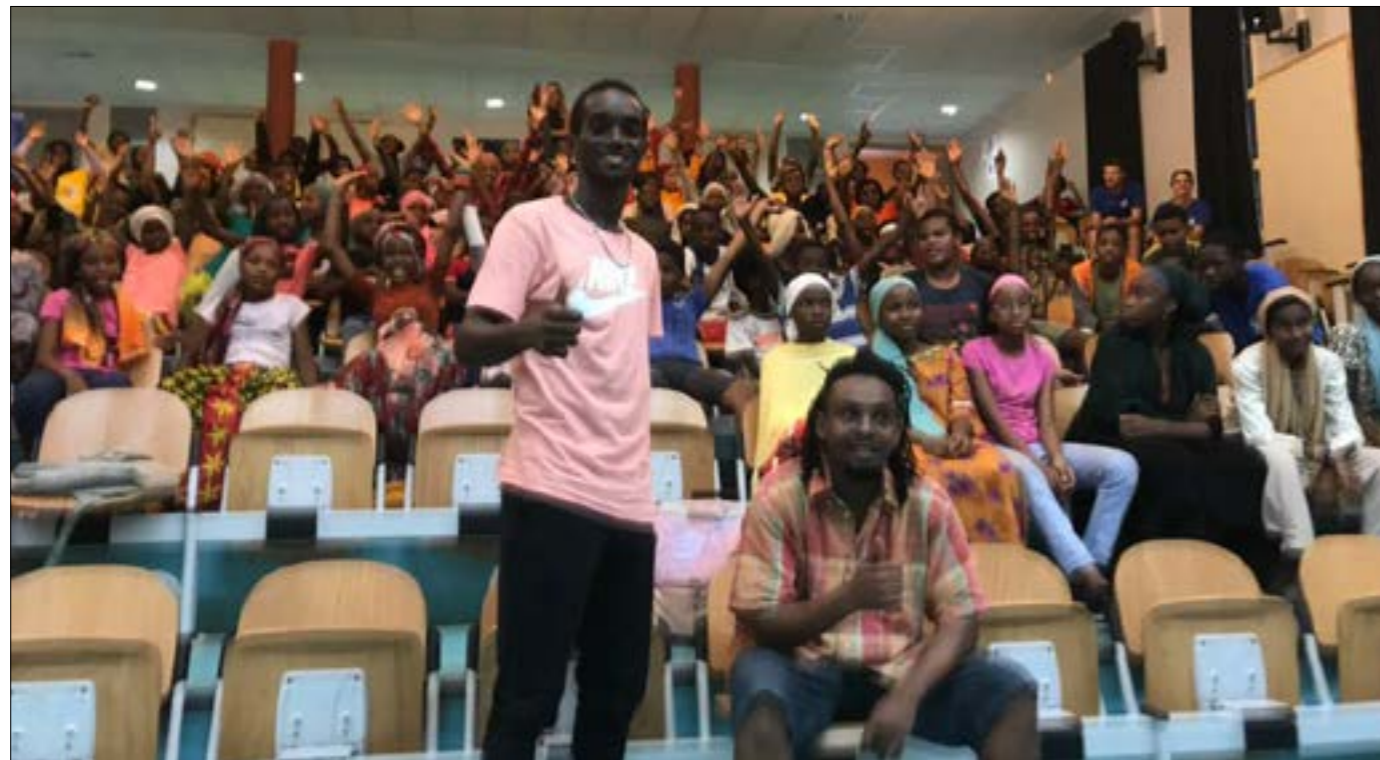
Kamel Zoubert est venu clôturer la semaine olympique et paralympique au collège de Kwalé

La semaine dernière était organisée « la Semaine de l'olympique et du paralympique » partout en France. Le collège de Kwalé s'est fortement investi pour célébrer cette manifestation en organisant de nombreuses compétitions sportives pour les élèves avec en point d'orgue la venue vendredi après-midi de l'athlète mahorais Kamel Zoubert.