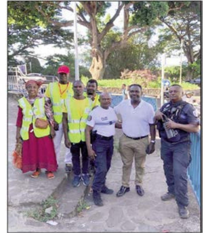
Des parents relais en compagnie du directeur de la police municipale (deuxième à partir de la droite) et du commandant de la police municipale de Dombéni (au centre).

Les parents intéressés peuvent s'inscri-