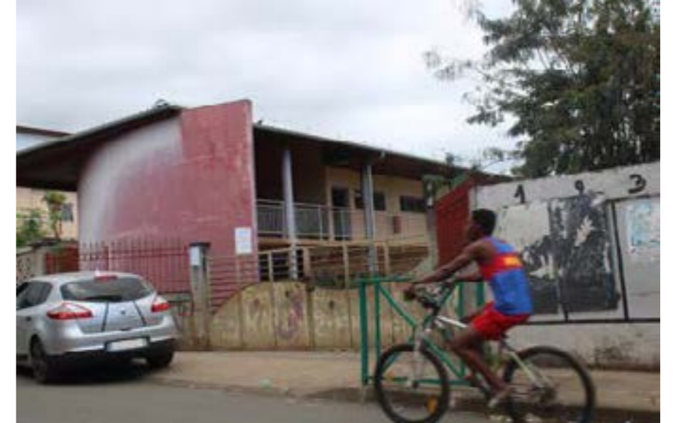
Un protocole spécial coupures d'eau se met en place dans les établissements mahorais.

Deux dispositifs seront mis en place en fonction des degrés d'enseignement. Pour les écoles et classes maternelles, du ressort des communes, "la décision de suspendre les cours suite à une coupure d'eau peut être immédiate". Dans les collèges et les lycées, la procédure est légèrement différente. "Le principe est de préserver au moins la demi-journée de travail complète", informe l'académie. C'est-à-dire qu'en cas de coupure intervenant dans la matinée, les élèves sont renvoyés chez eux vers midi (pour l'instant cela se fait en fonction des établissements). Il y aura toutefois une variante. "Avant de renvoyer les élèves, il est nécessaire de s'informer auprès de la SMAE (N.D.L.R. Société mahoraise des eaux), afin de connaître l'horaire de remise en service de la distribution d'eau, et de tout