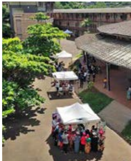
Une matinée de sensibilisation et d'information a été menée au sein du lycée de Tsararano, ce vendredi 7 avril.