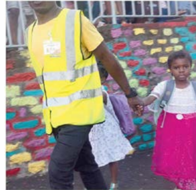
Un bénévole qui se charge d'accompagner les enfants.

stopper un véhicule en se mettant en travers de la route les bras en croix face au passage piétons pour