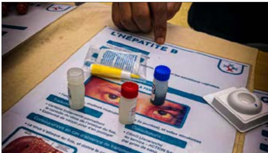
Kit de dépistage rapide de type VIH et VIB de l'association Nariké M'Sada

tertiaire, revenir sur les notions de consentement, de pratique, d'estime de l'autre, en plus des moyens de protection et contraception. Pour Jade et Antoine, agents de prévention de l'association Nariké M'Sada, c'est aussi la représentation à travers la pornographie et la violence sexuelle qui sont des sujets abordés en plus de ce qu'engendrent les maladies sexuellement transmissibles. Des maladies de types VIH ou bien Hépatite B, pouvant être justement dépistées à leurs prémices au sein même des locaux de l'association à Cavani, au moyen de kits tests mis à disposition.