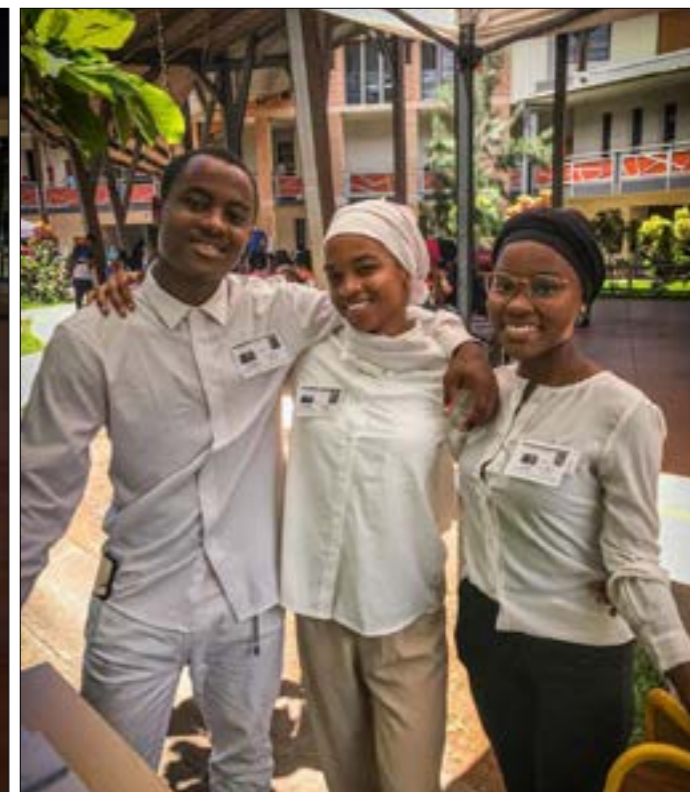
Une petite partie des BTS SP3S à l'origine de cette superbe matinée préventive