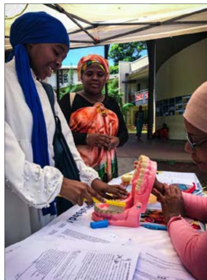
Comment se brosser correctement les dents ? Une question basique pourtant peu connue et/ou pratiquée au final