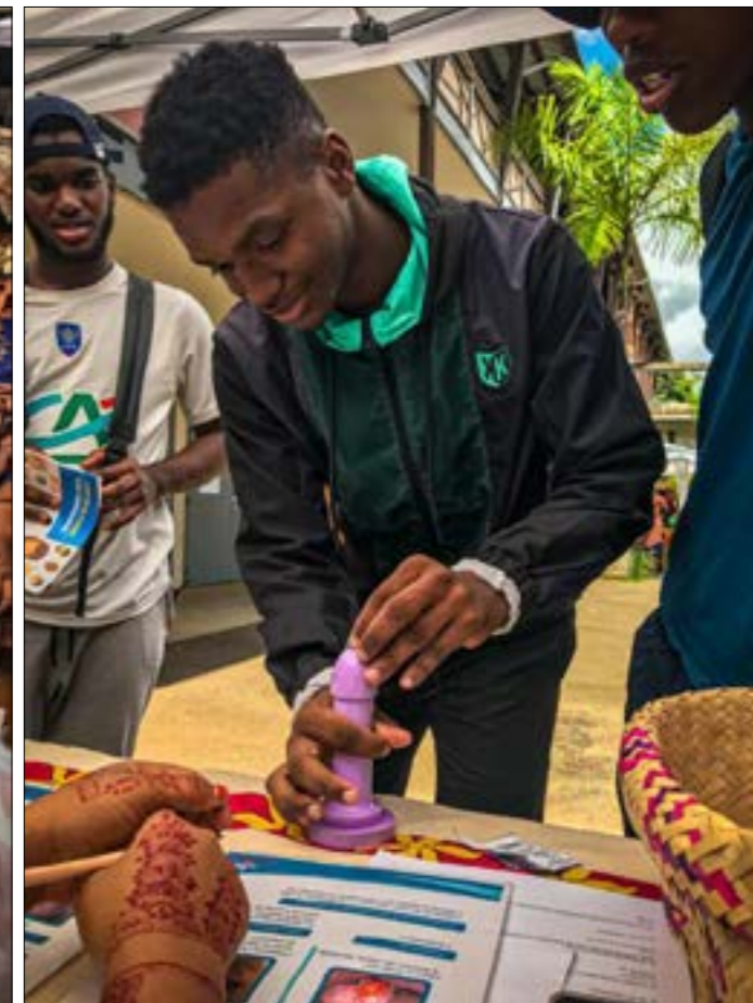
Pose quasi professionnelle d'un préservatif et conseils avisés entre lycéens et animateurs