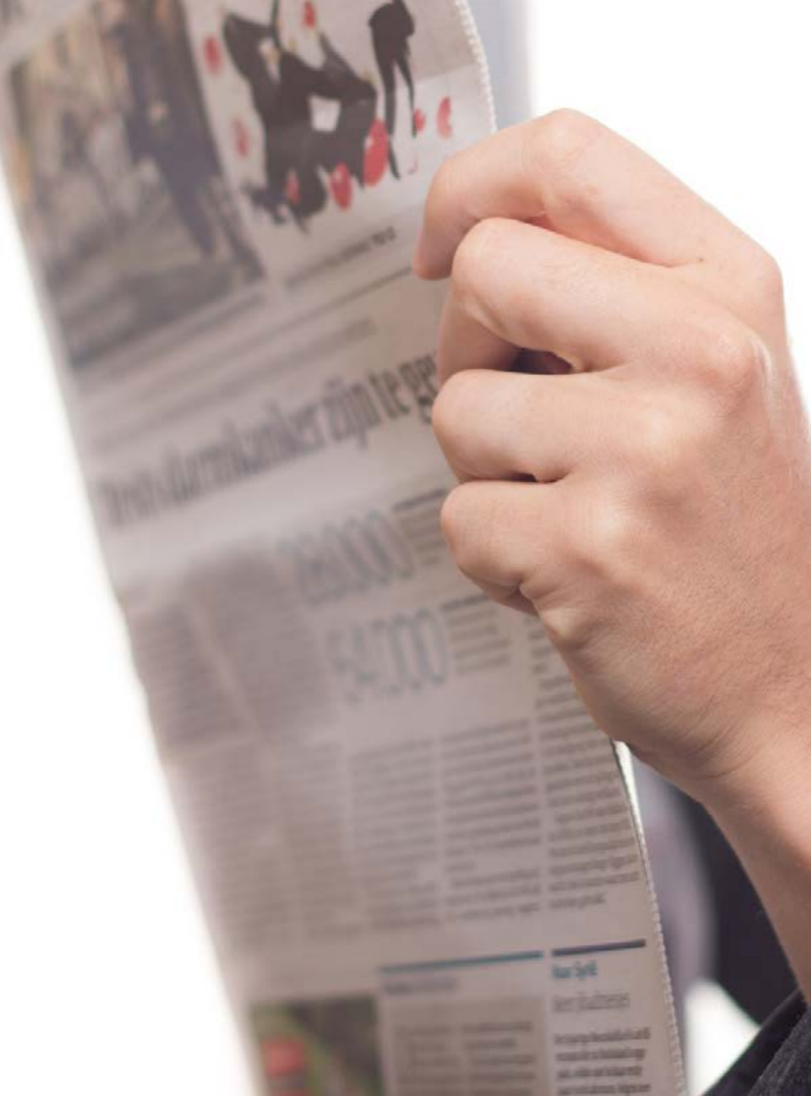
Revue de presse de la semaine