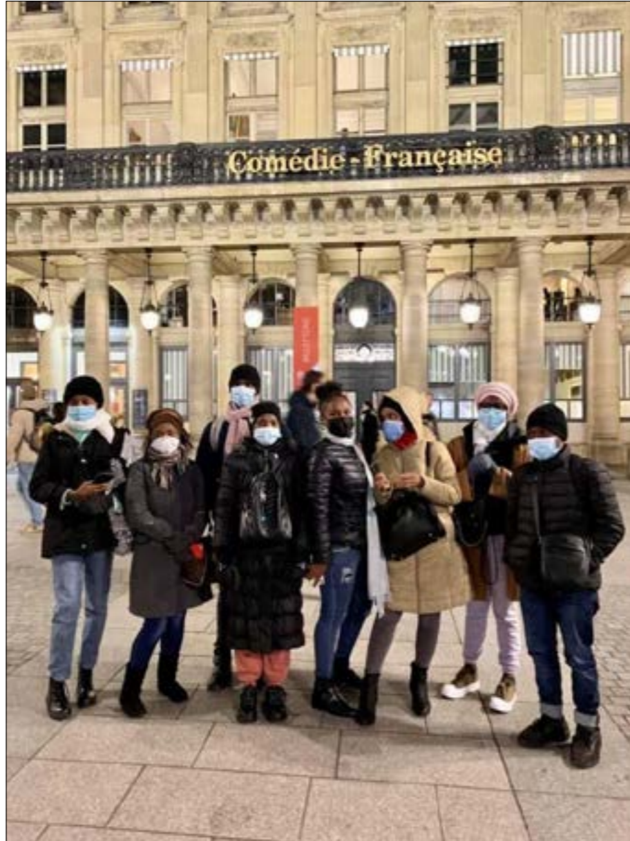
Immersion parisienne pour une soirée d'exception à la Comédie Française

Parce que la micro-insularité n'est pas un frein