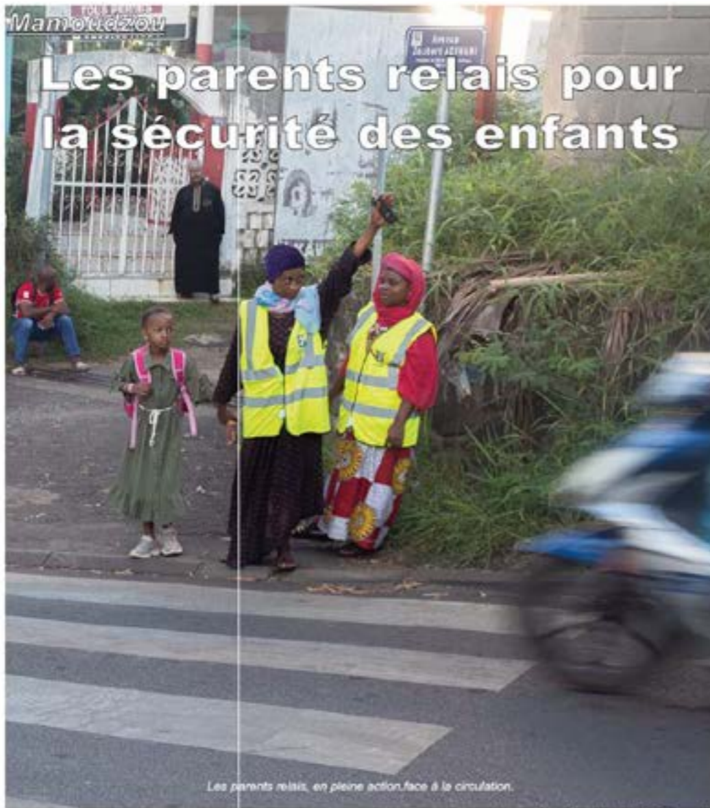
Les parents relais, en pleine action, face à la circulation.

7h du matin: Ecole des Manguiers Il est 7h00 du matin hier mercredi, la circulation est dense, les embouteillages se forment, les élèves se rendent à l'école à pied ou sont déposés par leurs parents qui en scooter, qui en voiture.