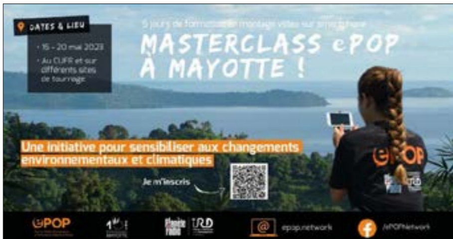
Prochaine masterclass dédiée au montage vidéo moderne support smartphone