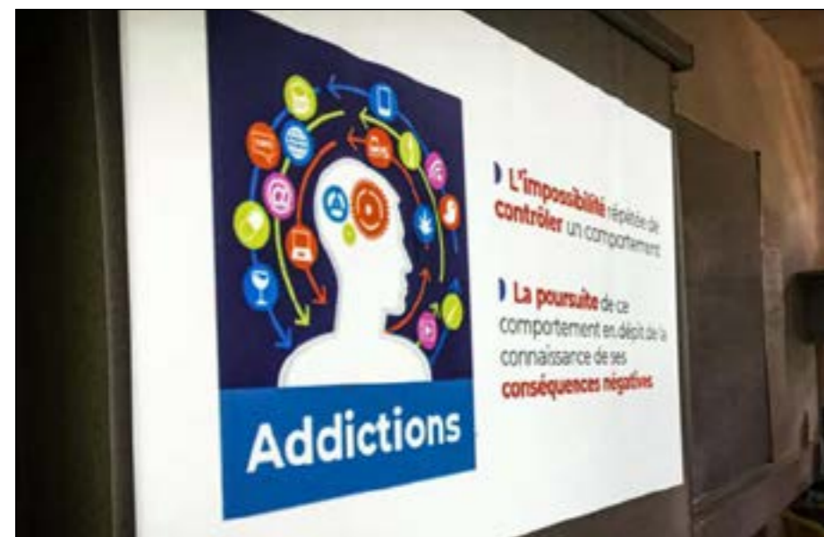
Qu'est ce que les addictions au sens large ?

*** Selon Santé Publique France, en 2019, 55,9%, des adultes de 15 ans et plus à Mayotte, étaient déjà en surpoids ou obèses (43,9% des hommes et 64,4% des femmes).