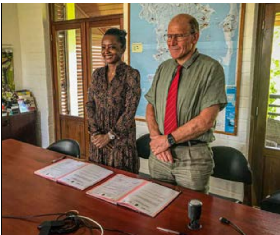
Mine réjouie et renouvellement acté de cette convention organisation et partenariat, près d'un mois après le succès de cette 2nde édition concours « Jeune Entrepreneur » qui se prépare de manière professionnelle au sein même des établissements scolaires de Mayotte

au regard d'autres territoires français ultramarins où, pour le coup, le cas se veut inversement proportionnel face à une population vieillissante. En somme, les Antilles ont tout le panel universitaire escompté, offre de formation et compétences, mais peinent à remplir leurs effectifs; pourquoi ne pas envisager une approche co-diplômante sous l'égide de la future Université de Mayotte , forgeant de surcroit l'enrichissement par l'expérience extérieure ?! « On s'enrichit toujours avec le regard des autres, là est la réelle plus-value » précise Monsieur le recteur.