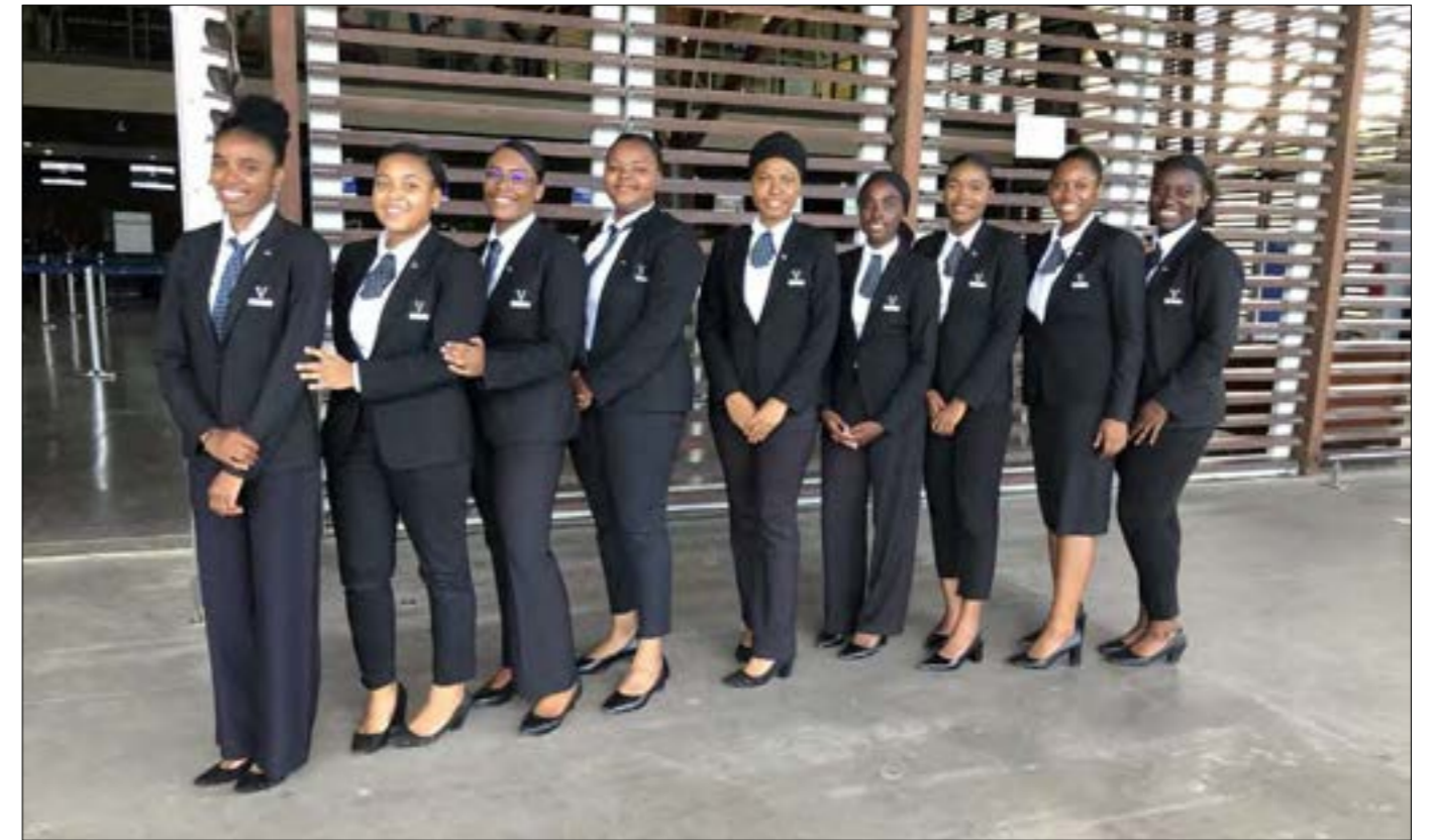
Décollage imminent pour ces ambassadrices mahoraises de l'hospitalité made in Vatel

C'est ce vendredi 7 avril dernier que les 9 étudiantes de cette seconde promotion de l'école internationale d'hôtellerie et de tourisme Vatel se sont envolées pour 5 mois de stage direction des établissements 4 à 5 étoiles à travers la Côte d'Azur, le Touquet mais aussi le Luxembourg,