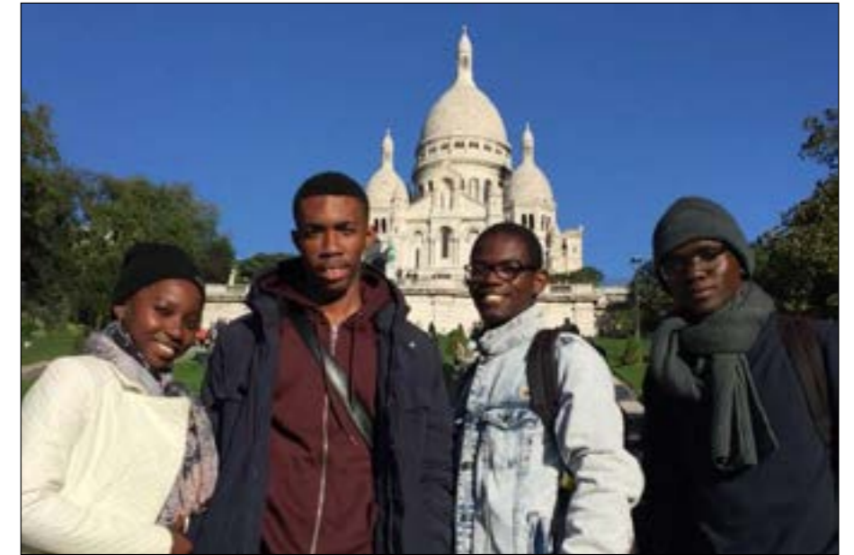
Visite de la Basilique du Sacré coeur (@Cufri)