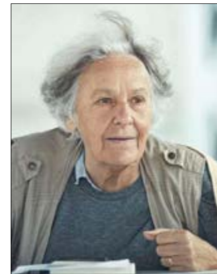
Ariane Mnouchkine, Réalisatrice et créatrice de la troupe du Théâtre du Soleil en 1964

sur 2 ans, représentant 524 heures de cours étalées sur le calendrier des congés, les périodes où il n'y a pas cours ou encore durant les créneaux Cufi dédiés à la Culture. Sous réserve d'un minimum de pratique, même informelle, et de connaissances initiales en la matière, d'un projet universitaire et /ou professionnel cohérent, les étudiants déjà inscrits en cycle universitaire, et même certains jeunes sans baccalauréat, ont pu postuler à cette toute première promotion. Une promotion de 11 élus qui s'achèvera en décembre prochain, parrainée par Ariane Mnouchkine / le Théâtre du Soleil à Paris mais également l' École supérieure de théâtre de l'Union à Limoges . La force de ce DU, au final tremplin, réside dans la création rapide et solide d'un réseau de contacts et d'échanges, garantissant ainsi concret suivi pour la poursuite du cursus de l'étudiant. Durant cette formation, totalement gratuite et prise en charge, les stages s'effectuent au Royaume des fleurs à Dzaoudzi , au Pôle culturel de Chirongui mais également à Limoges ou encore à Paris ; de quoi susciter davantage d'envie.